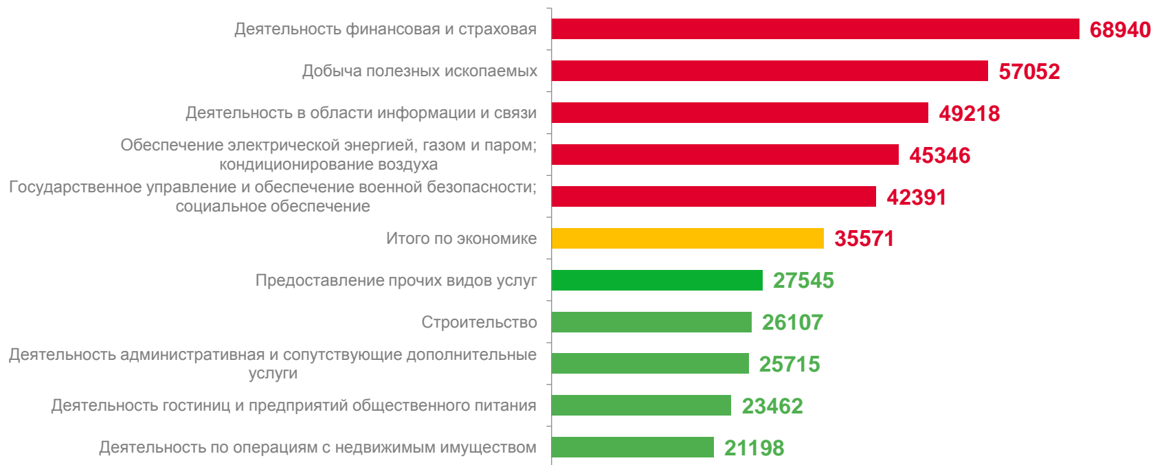
Виды экономической деятельности с наибольшей и наименьшей заработной платой в Алтайском крае, рублей

1) Среднемесячная номинальная начисленная заработная плата работников организаций исчисляется делением фонда начисленной заработной платы работников на среднесписочную численность работников и на количество месяцев в периоде.